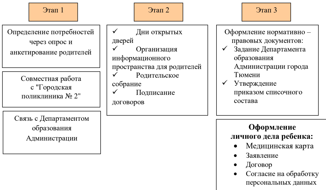
Рис. 3. «Этапы организации детей КМП»

С целью изучения степени удовлетворенности родителей качеством образовательных услуг консультационно – методического пункта, предоставляемых дошкольным образовательным учреждением, условиями пребывания их детей в детском саду, с целью выявления мнения родителей о получении образовательных услуг, а также возможные пожелания предусмотрено проведение социологического исследования удовлетворенности родителей качеством услуг консультационно – методического пункта, предоставляемых образовательным учреждением в периодичности 1 раз в квартал средствами анкетирования.